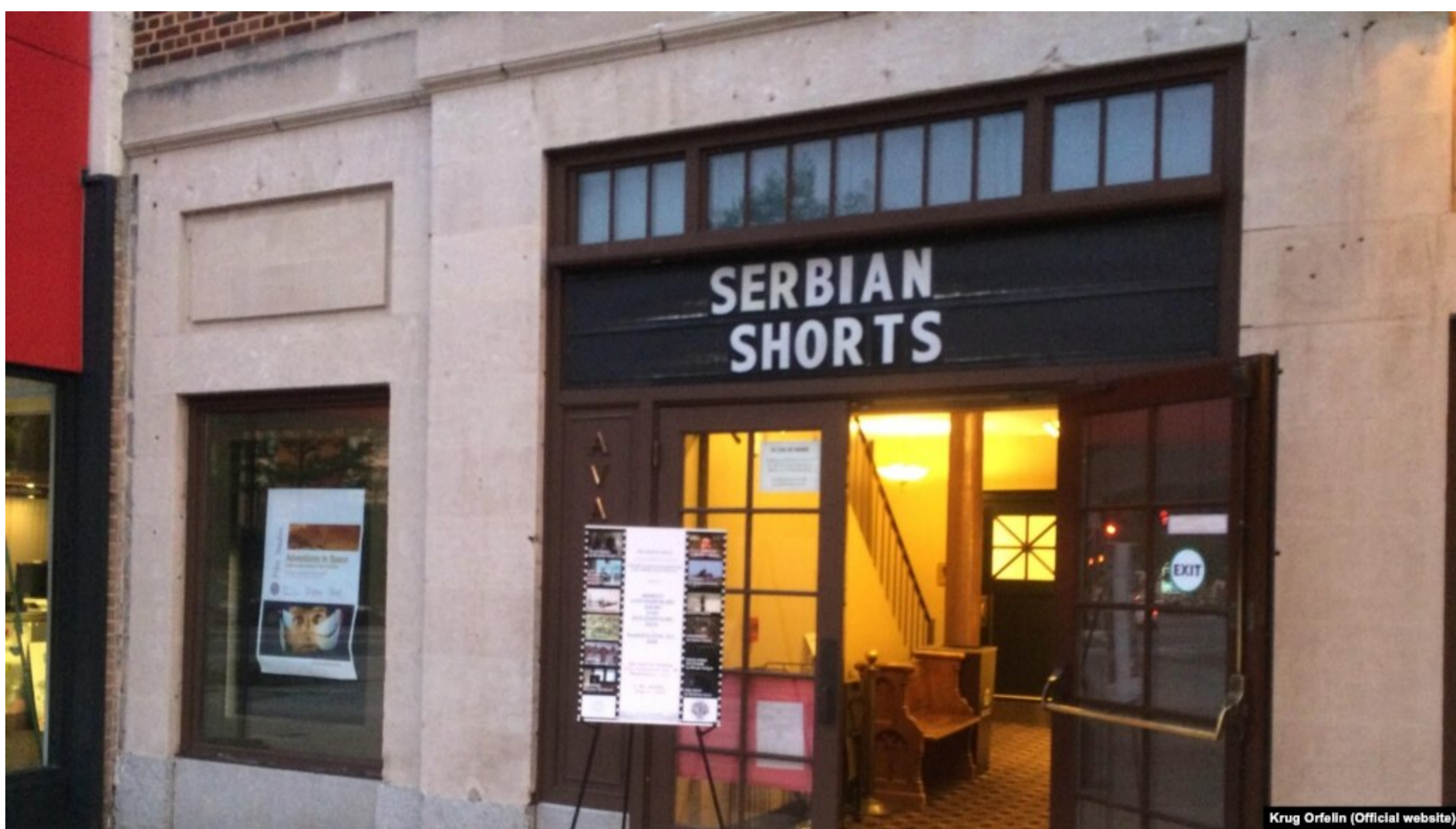
Festival kratkometražnog srpskog filma u Vašingtonu