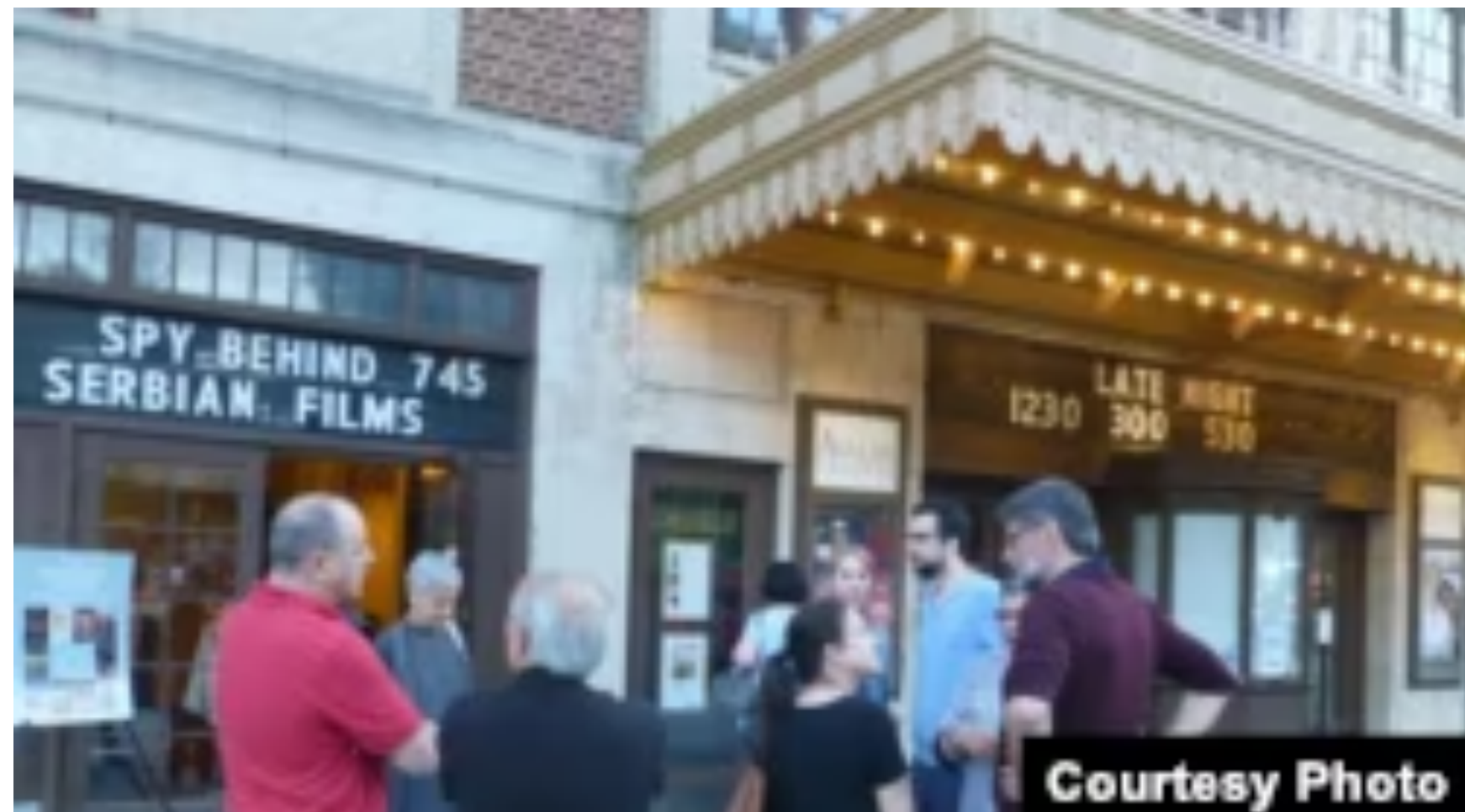
Publika ispred bioskopa Avalon na Desetom festivalu srpskog dokumentarnog filma.

"Obelažavanje jubileja je kao kao ucrtavanje tačaka na mapi postojanja. Tom zovu nije odoleo ni Orfelin Krug ove godine, svojim desetim Festivalom dokumentarnog, kratkog i eksperimentalnog srpskog filma", priča za Glas Amerike Svetlana Doroslovački , jedna od osnivača Kruga Orfelin.