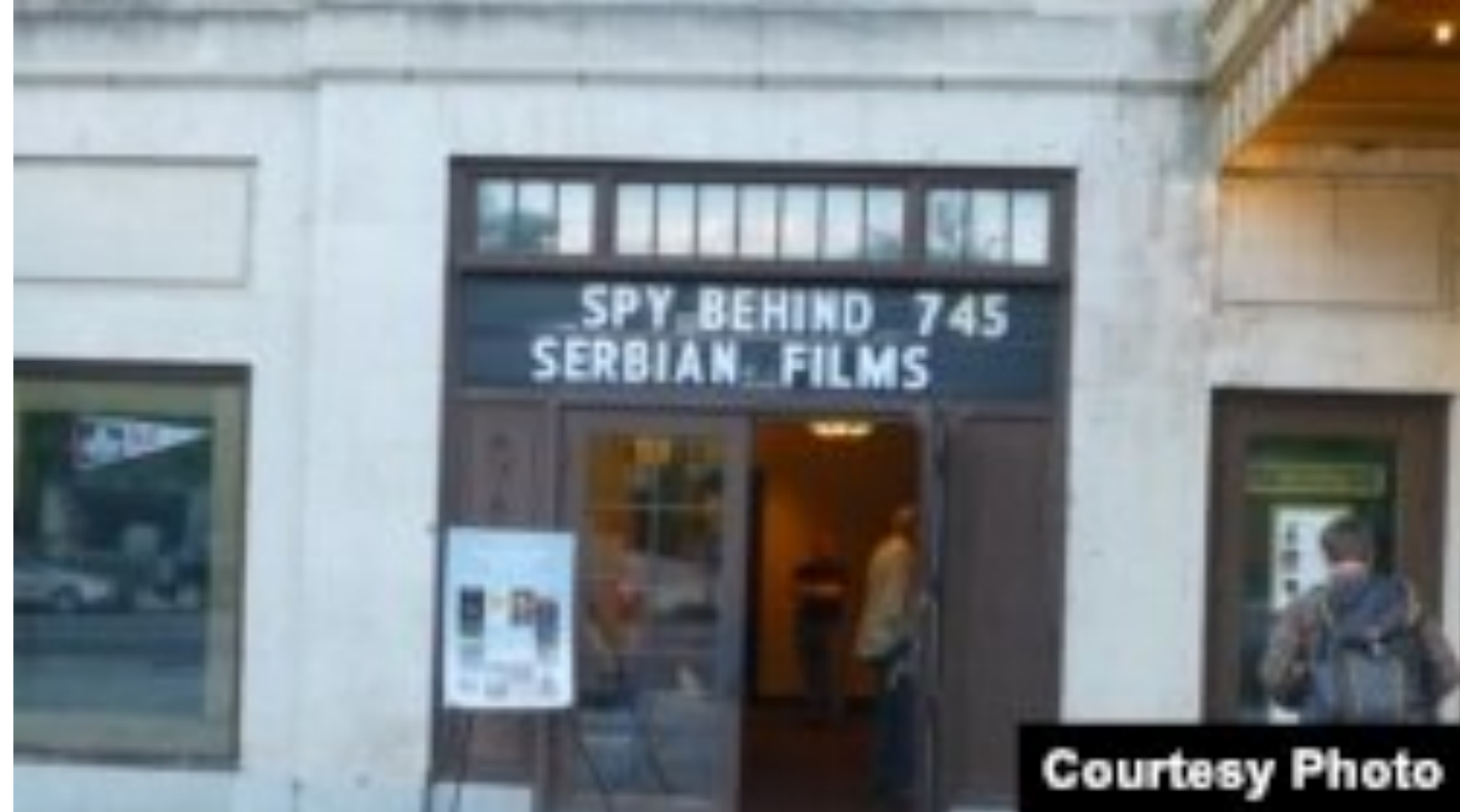
Bioskop Avalon - jedini je neprofitni filmski centar u Vašingtonu i promovise nezavisne, strane i dokumentarne filmove

"Pošto je ovo pogled unazad, možemo sa priličnom sigurnošću reći da su prikazani filmovi na X Festivalu izdržali izazov sadašnjosti, takođe i savremenosti u svojoj, pre svega, humanističkoj univerzalnosti, koja se odnosi na čoveka kao takvog, i svuda, što im daje onaj željeni kvalitet bezvremenosti. Što se tiče aktuelnosti, ovo je bilo dragoceno podsećanje na neke bolne trenutke iz srpske skorije prošlosti, prve večeri festivala. Kažem 'dragoceno' zato sto nam je pružilo utisak da je sada, ipak, poboljšana situacija, da je, ipak, život jači od svega, i da nam obnavlja nadu, usudujem se da kažem. Drugo veče je bilo posvećeno umetničkom i poetskom filmu. Publika je imala prilike i da se smeje i da plače..."