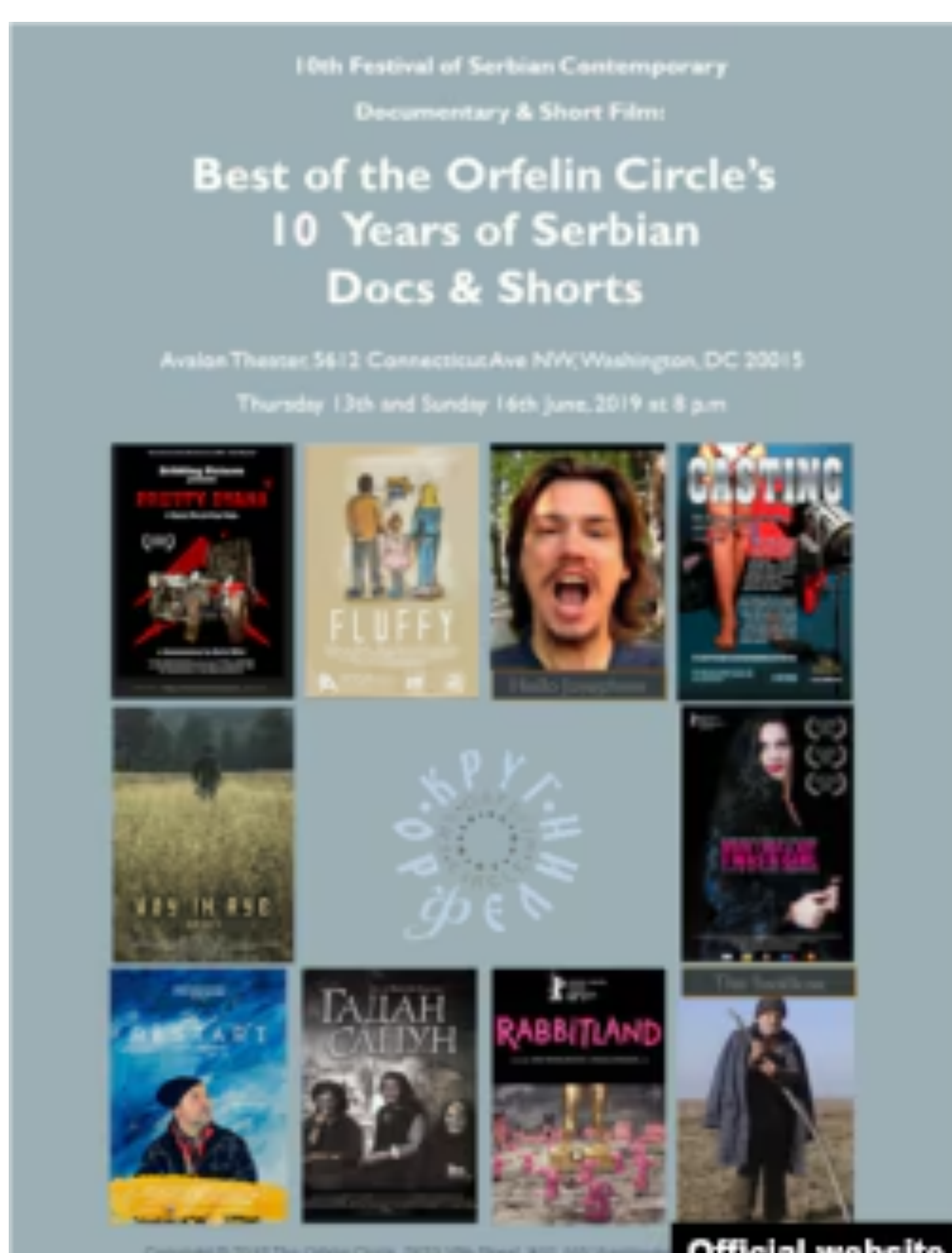
Zvanični poster 10. Festivala Kruga Orfelin

Orfelinov festival u Vašingtonu svake godine privuče malu ali lojalnu grupu gledalaca.