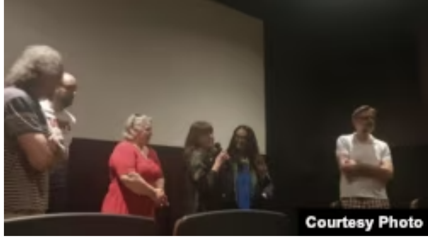
Članovi Kruga Orfelin razgovaraju sa publikom u bioskopu Avalon

Retrospektiva je otvorena autorskim filmom "Kasting" Gorana Radovanovića iz 2003. a, između ostalih, prikazani su i filmovi "Way in Rye" ("Raž") Gorana Stankovića, koji je 2013. bio američki kandidat za studentskog Oskara, kao i animirani film "Rabbitland" Ane Nedeljković i Nikole Majdaka, koji je osvojio brojna međunarodna priznanja uključujući i Kristalnog medveda u Berlinu 2013. Svetlana Doroslovački kaže da prikazane filmove odlikuju njihova humanost i teme koje su - svesremene.